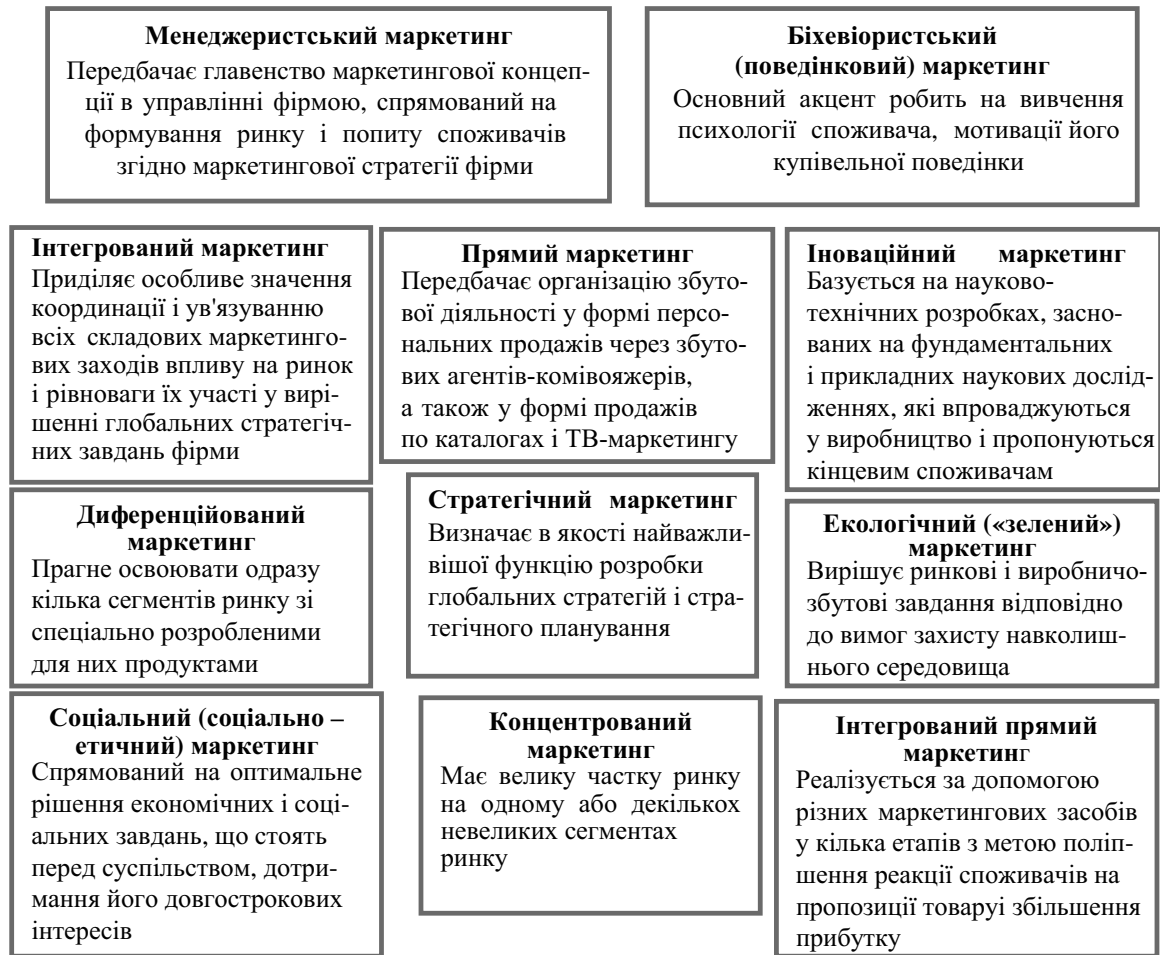
Рис. 1. Види маркетингу за структурою маркетингової концепції