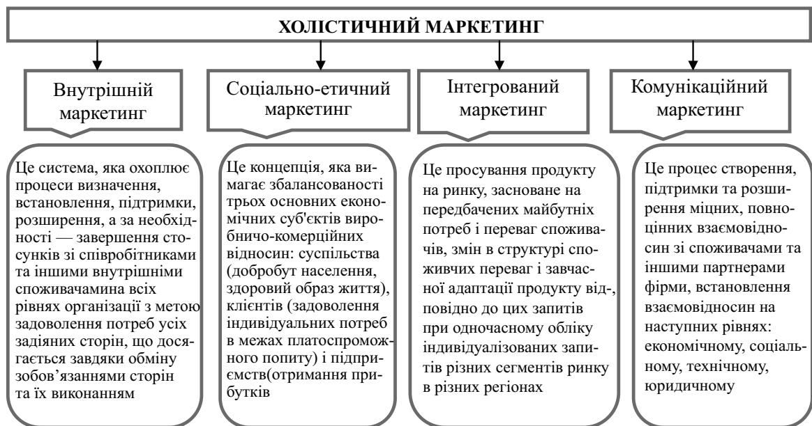
Рис. 2. Складові моделі холистичного маркетингу (узагальнено автором на основі [6, 7, 9, 10])