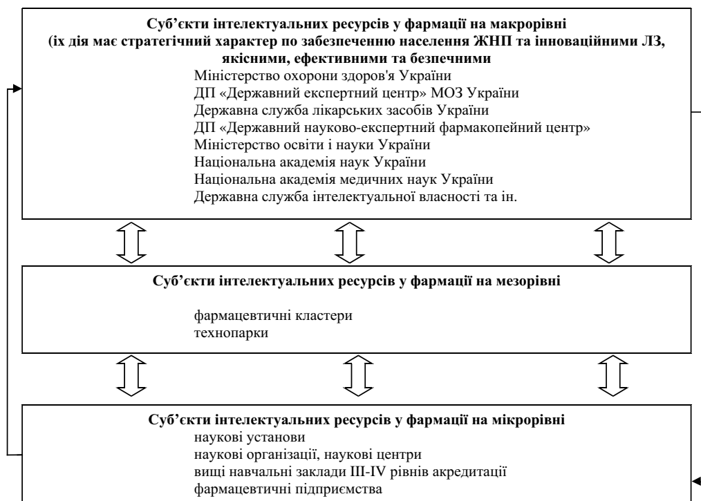
Рис. 2. Рівні суб'єктів інтелектуальних ресурсів у фармацевтичній галузі

навчальних закладів та забезпечують їх сталий соціально-економічний розвиток і стратегічну конкурентоспроможність.