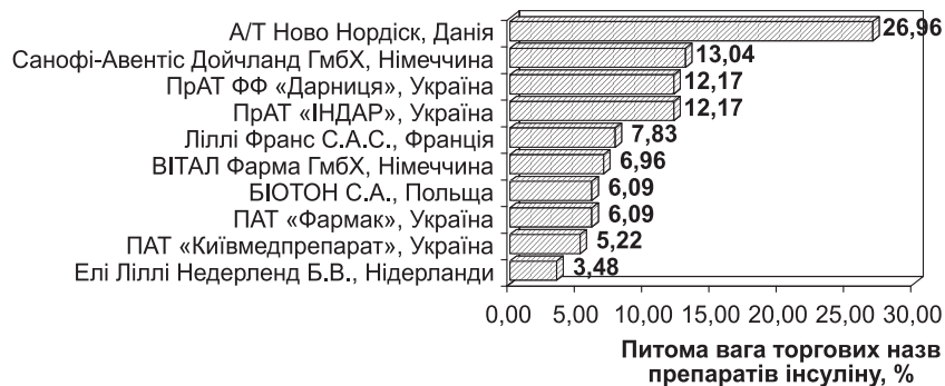
Рис. 2. Ранжування фірм-виробників за питомою вагою зареєстрованих препаратів інсуліну

Аналіз зареєстрованих препаратів інсуліну відповідно до референтних груп свідчить про те, що основна кількість торгових назв припадає на 1, 2 та 3 групи – 90 препаратів (з 115) або 78,26 % (табл. 1). При цьому більше третини асортименту