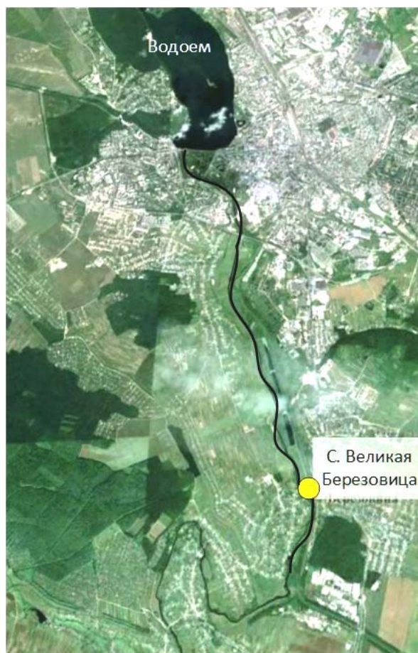
Рис. 2 – Расположение поста наблюдений у с. Великая Березовица на р. Серет и водоема перед ним.

Большое влияние на сток наносов оказывают водохранилища и небольшие водоемы, расположенные выше по течению (рис. 2), в которых оседает значительная часть естественных наносов. Изучая это явление Г. И. Швобс [14] отметил, что водохранилища, построенные на больших реках, в 2-2,5 раза могут уменьшать сток наносов на расстояние до 20 км. Путь, на протяжении которого происходит восстановление естественного стока наносов, зависит от уклона реки. Чем больше уклон, тем больше требуемое для восстановления расстояние.