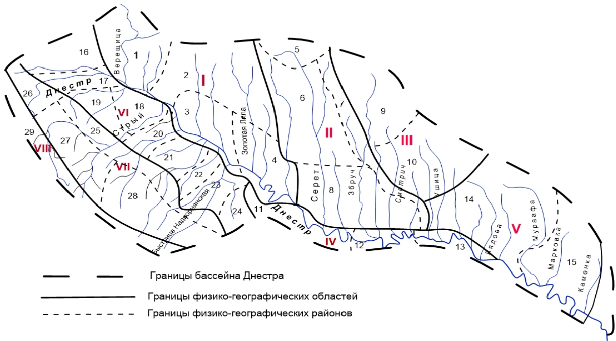
Рис. 1 – Физико-географическое районирование исследуемой территории по [33, 34] (названия областей и районов см. табл. 1)