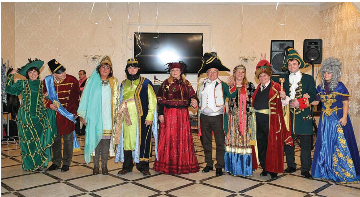
Під час товариської вечері делегати конференції УАЛДВК брали участь у театралізованому дійстві