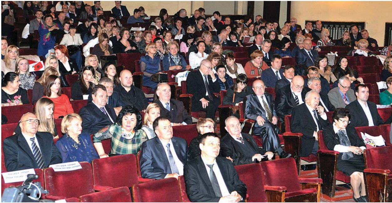
Делегати та гості науково-практичної конференції УАЛДВК, 23—24 жовтня 2013 року, Львів (актова зала Національного українського академічного драматичного театру імені Марії Заньковецької)