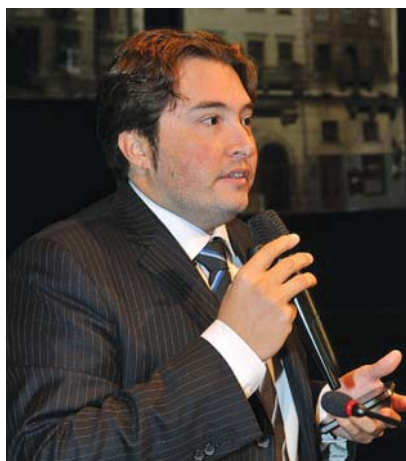
Доповідь на тему: «Особливості класифікації та лікування вітіліго» професора дерматології в Римському університеті Джульєльмо Марконі (Рим) та Європейському інституті дерматології (Мілан) П'єра Луїджі Корнаія Медічі