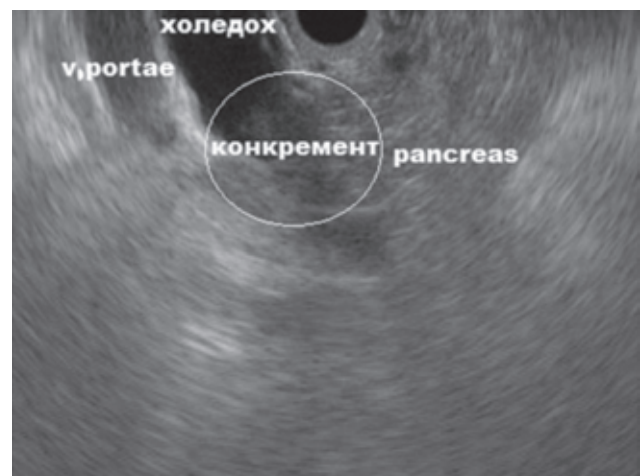
Рисунок 1. Конкремент дистального відділу холедоха

Методика передбачає дисекцію вздовж стінки міхура для циркулярної мобілізації шийки та лійки жовчного міхура та відділення її від печінки. При цьому треба впевнитися, що дві й тільки дві структури підходять до міхура — міхурова протока та артерія. Виконується повне роз-