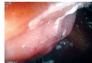
Рис. 4. LST-G ректосигмоидного отдела на фоне меланоза.

В прямой кишке (13-10 см) на фоне слизистой темно-коричневого цвета определяется экзофитное образование стелящегося типа, узловатое с плоским компонентом LST-G (0-Is+Ia), ярочный рисунок S. Kudo III-IV, NICE 2 (рис. 3, 4). Результат патогістологічного дослідження: тубулярно-ворсинчатая аденома с дисплазией II степени.