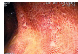
Рис. 2. Меланоз толстой кишки. Ярочный рисунок S. Kudo I.