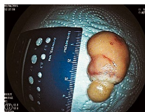
Рис. 3 Розмір новоутворення