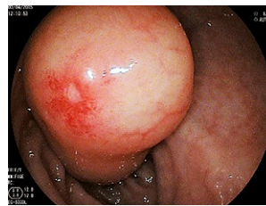
Рис. 1 Ліпома в просвіті сигмоподібної кишки

Обов'язкове проведення при наявності в клініці ендоскопічної соннографії або альтернативний метод підслизової ін'єкції фізіологічного розчину з метою гідросепарації та визначення інвазії новоутворення.