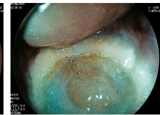
Рис. 2 Місце видаленого новоутворення