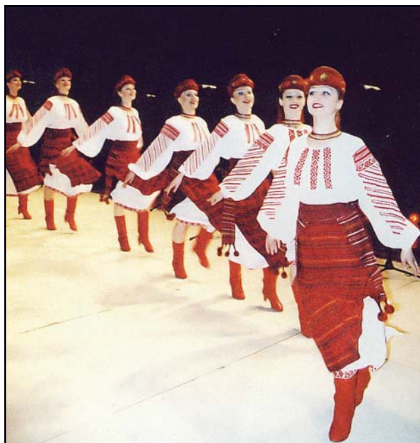
Жіночий танець «Голубка»