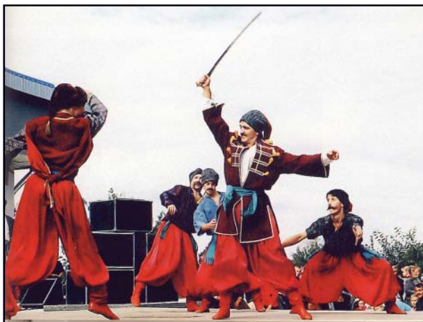
Забави запорозьких козаків

Коли співає справжній виконавець, йому не потрібно бігати по сцені, підтанцювувати, підбадьорювати до оплесків глядачів. Звучання його внутрішньої пісенної струни проникає глибоко в душу, до самого серця. Так, колеги