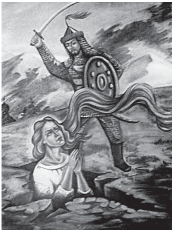
Репродукція до легенди про Анну

поїздки на Аннину гору, де розташований Аннинський жіночий монастир (304 метри над рівнем моря). Гору на околиці Вашківців Вижницького району священною вважали здавна. Кримські татари та турки робили набіги на буковинські, подільські землі, спустошуючи села, поневолюючи людей, особливо молодь. Це продовжувалося до XVI ст., що відображено в історичних переказах, народних піснях, баладах, легендах. Одна з них розповідає, що в той час, коли Буковина знаходилася під турецьким