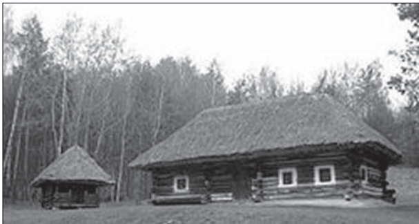
Селянська садиба XIX ст. з села Коритне у музеї Пирогово

Вишницький район розташований у південно-західній частині Чернівецької області. По річці Черемош він межує на південному заході з Косівським районом Івано-Франківської, на південному сході – зі Сторожинецьким, на заході – з Путильським районом Чернівецької області, на півдні – з Румунією. На основі археологічних знахідок відомо, що перші стоянки людей