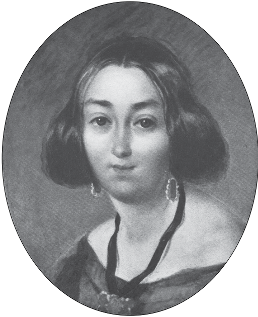
Портрет Г.І.Закревської, 1843

буття. Попри зовнішню подібність композивання обох портретів, їх технічне виконання дуже різниться між собою. Гладеньке письмо з лісируваннями і блисками, зіткане з уривчастих енергійних мазків на портреті Т. Маєвської, та широкі, з м'якою моделюючою пластикою, насичені кольором у портреті «Ганни вродливої». Тут немає «душевної дистанції», пристрасно закоханий художник повністю розчиняється у своїй моделі, якій присвятив незрівнянні перлини любовної лірики. Попри скульптурність моделювання, портрет дає дивне відчуття іконописної площинності. Люблячо відкритий за пеленою сльози погляд «чорних, аж голубих» очей ніби виводить зображення з полотна до глядача.