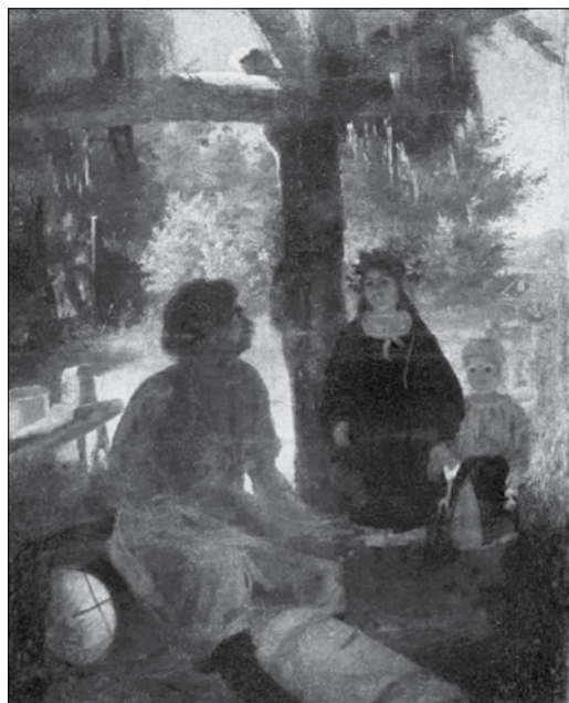
На пасіці, 1843

Великим успіхом Шевченка-живописця була серія олійних портретів,