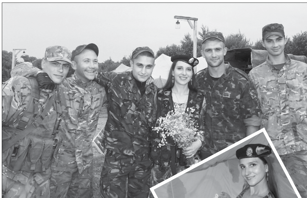
Квіти від захисників

частинах с. Гончарівське Чернігівської області. На полігоні розташувалися дві танкові бригади, але перед очима артистів постала справжня картина нашої завідома знищеної української армії. Частина була покинута близько десяти років тому, у казармах вибиті вікна, на деяких будівлях відсутні покрівлі, вся інфраструктура знищена, солдати жили в палатках на плаці.