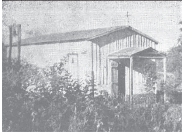
Перша українська церква у Трес Капонес