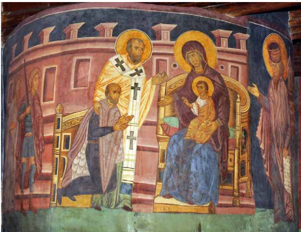
Руські маляри, під керівництвом майстра Андрія. Польський король Владислав II Ягайло на колінах перед Богородицею з Ісусом-Дитям (фрагмент фрески «Христос у Преторії». Каплиця Святої Трійці. м. Люблін, Республіка Польща). 1418 р.