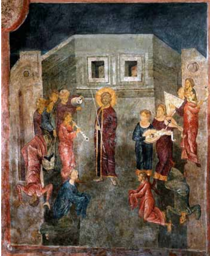
Руські маляри, під керівництвом майстра Андрія. Музиканти, співаки та скоморохи (танцюристи-акробати) короля Владислава II Ягайла (фрагмент фрески «Христос у Преторії». Каплиця Святої Трійці. м. Люблін, Республіка Польща). 1418 р.