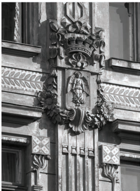
Вул. Руська, 20 – північний фасад будинку “Дністра” і відповідна деталь архітектурного рисунка, виконаного Т. Обмінським (ДАЛО. – Ф. 2. – Оп. 2. – Спр. 3806. – Арк. 102). Сецесійні маски, передбачені у проекті, було замінено на рельєфні герби.