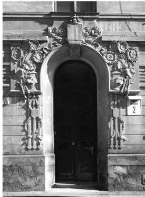
Типово сецесійні форми львівських фасадів, проєктованих Обмінським у середині 1900-х рр.: вул. Чайковського, 6 – причілок кутового еркера; Богомольця, 4 – аттик з маскою; Павлова, 2 – маска під карнизом; Глібова, 2 – рельєфи вхідного порталу.