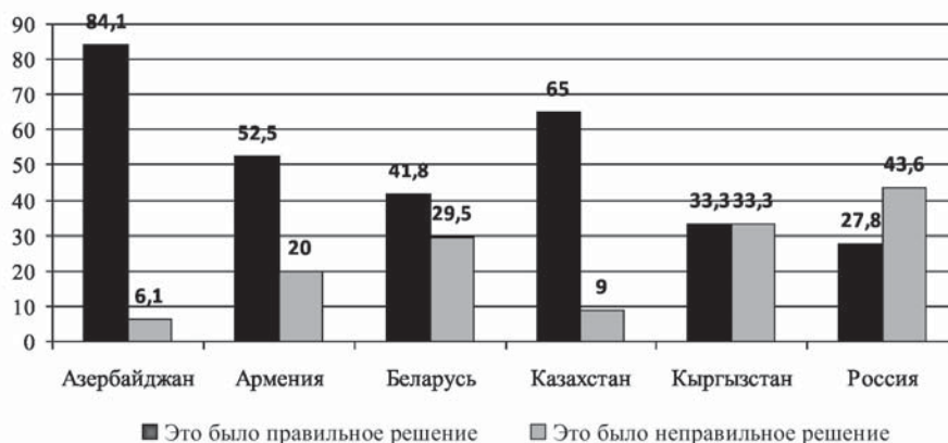
Рисунок 1. Оценка решения о ликвидации СССР (% к опрошенным)

позитивно оценивают, считают правильным более половины опрошенных студентов из