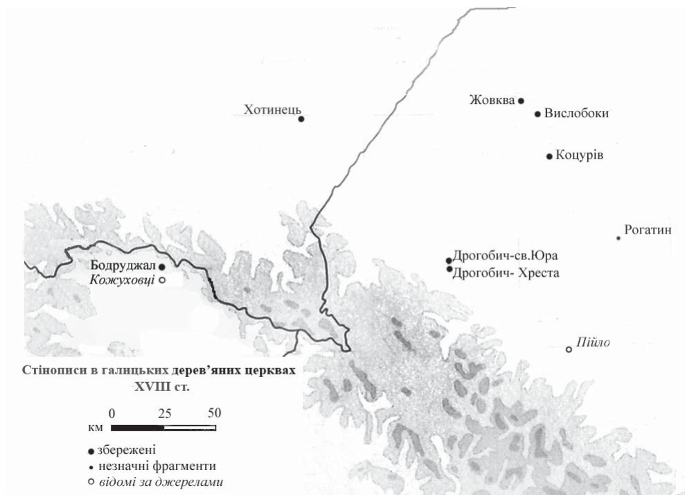
Мапа 2. Стінописи в галицьких дерев'яних церквах XVIII ст.