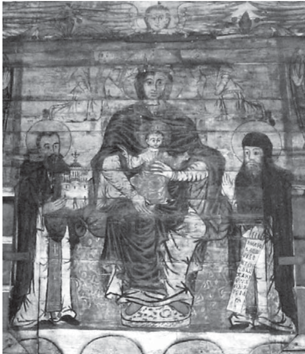
Іл. 1. Потелич, церква Святого Духа.

Богородиця з Дитям на престолі, обабіч св. Антоній і св. Феодосій