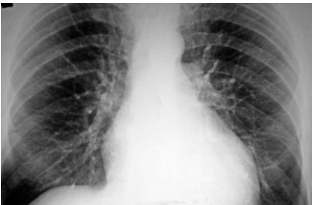
Рис. 1. Рентгенограмма органов грудной клетки пациента 3 при госпитализации.

Учитывая жалобы на головокружение в состоянии покоя при хорошей переносимости физических нагрузок, отсутствие симптомов СН, стабильную гемодинамику, дисфункцию синусового узла и вагусный генез предсердной эктопии по данным ХМ ЭКГ, медикаментозную терапию не назначали.