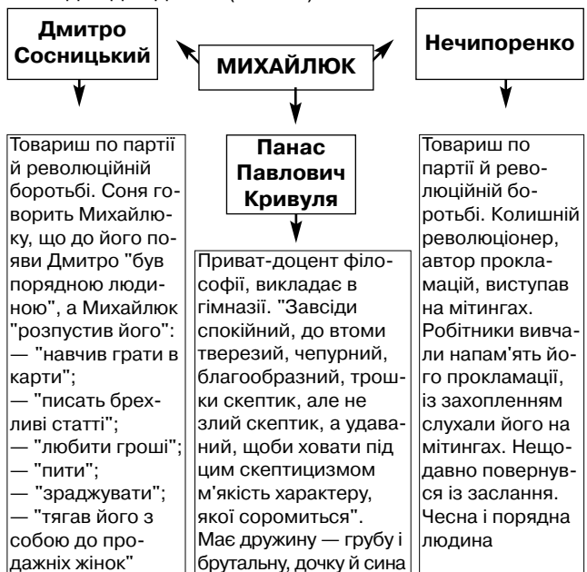
Рис. 2. Михайлюк і чоловічі образи

Образ Михайлюка розкривається через діалоги з героями твору, внутрішні монологи, описи Києва. Усі чоловічі образи роману дотичні до образу Михайлика. Простежимо за їхньою мовою, поведінкою, ставленням один до одного. (Рис. 2.)