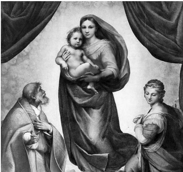
Рафаель. Сікстинська мадонна. 1515 р.

У якому з творів Рафаеля простежується шлях від подолання наївності та безтурботності світлої материнської любові до образу, сповненого високої духовності й неосяжного трагізму?