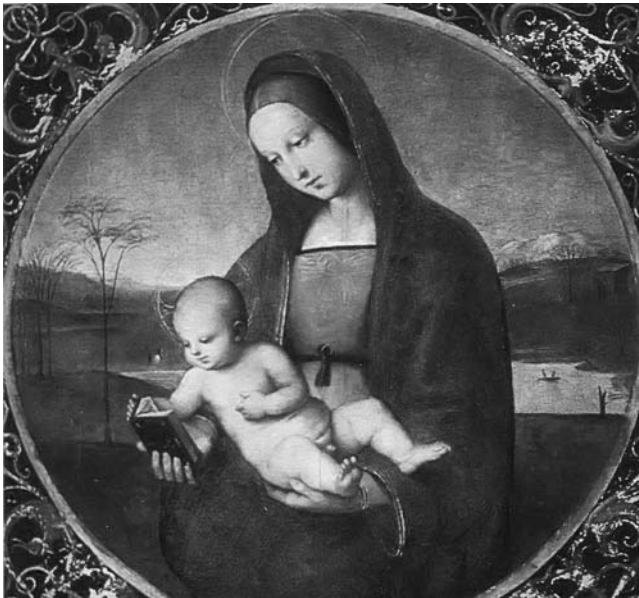
Рафаель. Мадонна Конестабіле. 1500 р.