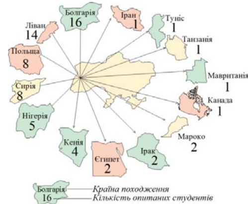
Рис. 1. Розподіл респондентів за країною походження

Результати й обговорення. Як видно з даних рис. 1, у вибірку увійшли студенти з Азії (36,5%), Європи (36,5%), Африки (25%) та Північної Америки (2%). Найбільша кількість студентів вибірки походила з Болгарії, Лівану, Польщі та Сирії. Такі країни як Канада, Іран, Мавританія, Танзанія та Туніс були представлені лише по одному респонденту.