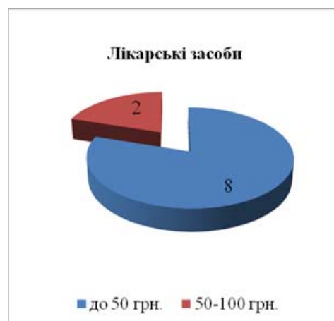
Рисунок. Розподіл аналізованої сукупності СХП і лікарських засобів на групи за величиною роздрібної ціни