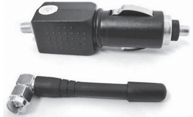
Рис. 3. Пристрій генерування завад

На думку деяких фахівців, наша залежність від GPS стає дуже небезпечною, з огляду на виняткову ненадійність цієї технології. Проблема в тому, що сигнал із супутника дуже слабкий, і заглушити його надзвичайно легко, якщо генерувати шум на тій же частоті. Сигнал можна заглушити примітивним пристроєм (рис. 3) [3].