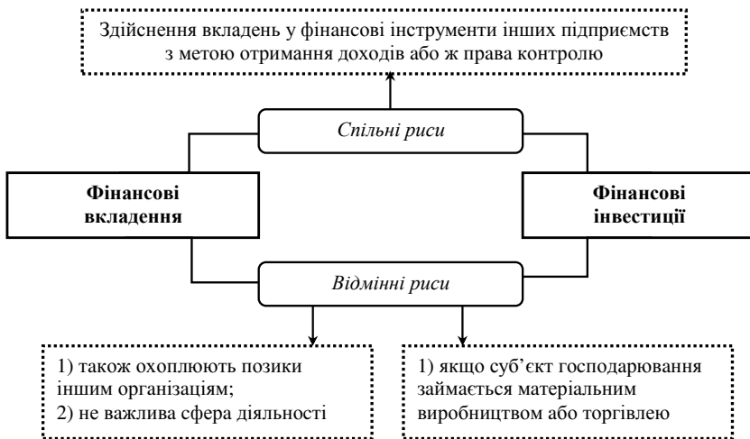
Рис. 1. Порівняння понять «фінансові вкладення» та «фінансові інвестиції»

Якщо ж говорити про фінансові вкладення – це абстрактні кошти, котрі мають давати підприємству дохід протягом певного часу. При чому, не зазначено, протягом якого періоду це повинно бути здійснено. Тобто дане вкладення може дати підприємству дохід як у поточному періоді, так і в довготерміновому. До фінансових вкладень відносять: внески в статутні капітали інших підприємств (у т. ч. дочірніх), у цінні папери (акції, облігації) інших підприємств, процентні облігації державних та місцевих позик, на депозитні рахунки банків, на ощадні сертифікати; позики, надані іншим організаціям; вкладення майна за договорами про спільну діяльність. Якщо ж звернути на фінансові вкладення детальнішу увагу, то можна зробити висновок, що не всі вкладення капіталу є фінансовими інвестиціями. Так, у будь-якої юридичної особи, зайнятої в сфері матеріального виробництва або торгівлі, вилучення ресурсів у вкладення з метою отримання доходу означатимуть фінансові вкладення. В організаціях, що зайняті у фінансовій сфері і належать до професійних учасників ринку цінних паперів, фінансові вкладення не є вилученням ресурсів та, відповідно, не служать фінансовими вкладеннями. Для названих організацій робота з цінними паперами, що придбані за власні кошти і за кошти клієнтів, становитиме предмет їхньої основної (статутної) діяльності. На рисунку 1 наведено спільні та відмінні риси між поняттями «фінансові вкладення» і «фінансові інвестиції».