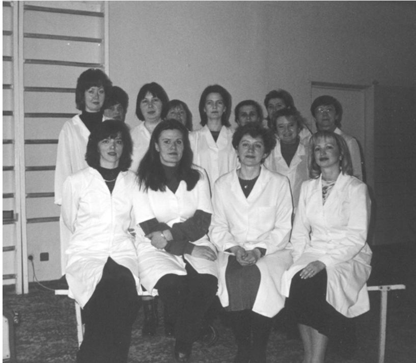
Співробітники фізіотерапевтичного відділення. 2001 рік.

міхура та кишечнику), електрофорезу лікарських речовин, ультрафіолетове опромінення, масаж кінцівок, спини та грудної клітки. В реанімаційних відділеннях, крім того, відпускаються процедури інгаляції лікарських речовин та відварів відхаркувальних трав. На базі ФТВ відпускаються процедури на стаціонарній апаратурі. Проводяться електростимуляція м'язів глотки внутрішньоглотковим електродом, ультразвукова терапія та фонофорези різних медичних препаратів, УВЧ-терапія, д'арсонвалізація, індуктотермія, магнітотерапія, виконуються парафіно-озокеритові аплікації. З 1995 р. почала застосовуватись лазеротерапія: гелій-неоновим, інфрачервоним лазерами у постійному та імпульсному режимах, магнітолазером. Лікарі відділення здійснюють електростимуляцію мимічної мускулатури при невритах лицьового нерва, ЕС зовнішніх м'язів очного яблука та верхньої повіки при окорухових порушеннях, обумовлених дисфункцією III, IV, VI черепних нервів. Було отримано авторське свідоцтво "Спосіб лікування окорухових порушень", в якому вперше запропоновано застосовувати в комплексному лікуванні цієї патології у нейрохірургічних та неврологічних хворих ультразвукову терапію в імпульсному режимі, з наступною електростимуляцією окорухових м'язів.