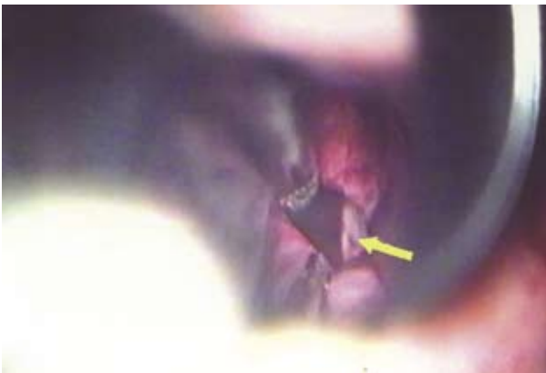
Рис. 3. Ликворный свищ