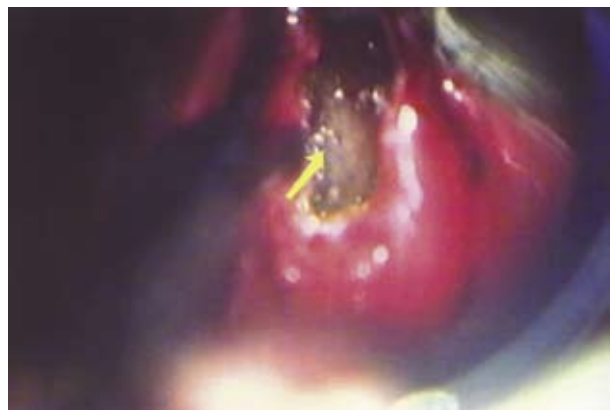
Рис. 4. Произведена облитерация клиновидной пазухи полиуретаном