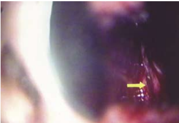
Рис. 1. Апертура клиновидной пазухи, через которую выделяется ликвор