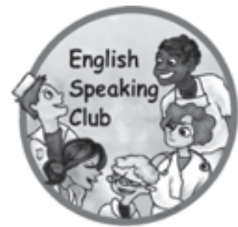
Рис. 4. Офіційна символіка Медико-лінгвістичного клубу “English-Speaking Club”

Дуже важливим напрямом діяльності організації у звітному році було налагодження і розширення зовнішніх контактів. Провідною подією у розвитку міжвузівського співробітництва стало проведення 23–24.02.2011 р. на базі НМУ імені О.О.Богомольця IV Всеукраїнського з’їзду представників студентських наукових товариств вищих медичних (фармацевтичних) навчальних закладів.