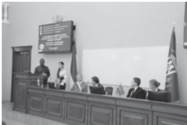
Рис. 2. Перше пленарне засідання III (65) Міжнародного науково-практичного конгресу студентів та молодих вчених “Актуальні проблеми сучасної медицини”

високі технології в медицині, психологічні та гуманітарні аспекти діяльності лікарів.