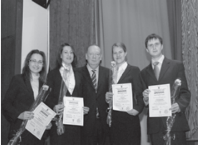
Рис. 8. Лауреати Премії НАМН України та Асоціації вищих медичних навчальних закладів України разом з ректором НМУ імені О.О.Богомольця академіком НАМН України, професором В.Ф.Москаленком

Події з життя організації висвітлювалися у засобах масової інформації, зокрема на шпальтах газет “Медичні кадри”, “Ваше здоров’я” і видання “Український науково-медичний молодіжний журнал”.