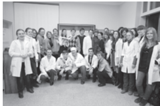
Рис. 5. Члени Медико-лінгвістичного клубу “English-Speaking Club”

На форумі учасники презентувати свою діяльність та обмінятися досвідом з колегами, обговорили актуальні проблеми науково-дослідної роботи студентів та шляхи їх вирішення, роль сучасних інформаційних технологій, зовнішню діяльність наукових товариств, нову редакцію Закону України “Про вищу освіту”, фінансування студентської науки. Було піднято питання про подальше об’єднання молодих науковців в галузі медицини і фармації під прапорами єдиної організації.