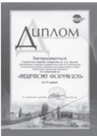
Рис. 9. Отримання диплому на Міжнародній спеціалізованій виставці “Медичний форум – 2011”

діяльність студентів як пріоритет вищої освіти” (16.05.2011 р.) у Міністерстві освіти і науки, молоді та спорту України та був обраний до складу робочої групи з розробки проекту Типового положення про наукові товариства студентів та аспірантів вищих навчальних закладів, а також на Форумі молодих новаторів (25.11.2011 р.), де отримав грамоту за активну участь в обговоренні стратегії розвитку наукової та інноваційної діяльності студентів у нашій державі.