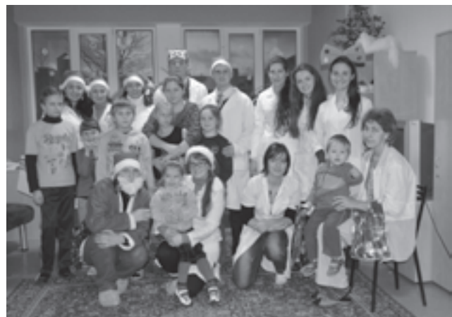
Рис. 10. Соціальна робота товариства

До Дня Св. Миколая члени СНТ та профкому студентів НМУ імені О.О.Богомольця спільно організували низку святкових зустрічей з пацієнтами дитячих лікарень міста Києва. Була успішно проведена благодійна акція “Від щирого серця Миколая”: представники вищезазначених організацій відвідали з театралізованою виставою маленьких пацієнтів у відділенні торакоабдомінальної хірургії Національної дитячої клінічної спеціалізованої лікарні “Охматдит” та дитячому відділенні Дорожньої клінічної лікарні №1 Південно-Західної залізниці.