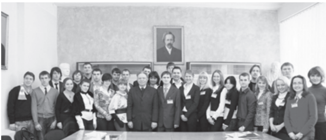
Рис. 6. Учасники IV Всеукраїнського з'їзду представників студентських наукових товариств вищих медичних (фармацевтичних) навчальних закладів