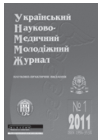
Рис. 11. Черговий випуск “Українського науково-медичного молодіжного журналу”

Активісти товариства провели тренінг “Здоровий спосіб життя – запорука успіху” та були нагороджені почесними дипломами на II Всеукраїнському біологічному форумі студентської та учнівської молоді “Дотик природи” (17–18.10.2011 р.).