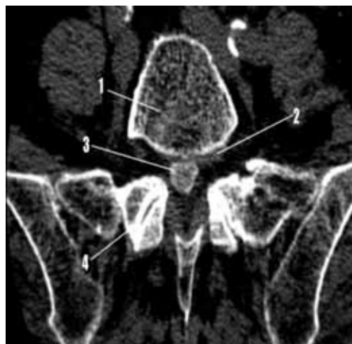
Рис. 1. Хвора Ж, 56 років. Клінічний діагноз: ДДЗ (остеохондроз, спондилоартроз, остеопороз, грижі міжхребцевих дисків) поперекового відділу хребта. МДКТ, аксіальний скан. 1-тіло L5, щільність якого знижена внаслідок остеопорозу; 2,3-дорсолатеральна протрузія міжхребцевого диску із секвестрацією; 4-ущільнення суглобових поверхонь зі звуженням між хребцевих отворів L4-L5.