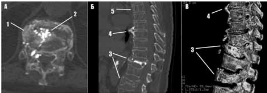
Рис. 3А-В. Хворий К., 52 роки. Клінічний діагноз: ДДЗ (остеохондроз, деформуючий спондилоз, патологічні переломи Th 9,11, гемангіома Th3) грудного відділу хребта. МДКТ, аксіальний скан: 1,2-тіло Th9, із декількома лінійними переломами, деталізація яких лише на даному скані неможлива, 3-клиновидна деформація тіл Th 9,11 зі зниженням їх висоти за рахунок компресійних переломів; 4-крайові клювовидні кісткові вирости (остеофіти); 5-гемангіома тіла Th3.

Фіксуєний лігаментоз , виявлений у 1 хворого (1,2%), мав вигляд масивної осифікації передньої поздовжньої зв'язки на протязі 5 рухових сегментів грудного відділу хребта, товщиною 0,9 см, що чітко візуалізувалося при застосуванні МПР у сагітальній проекції.