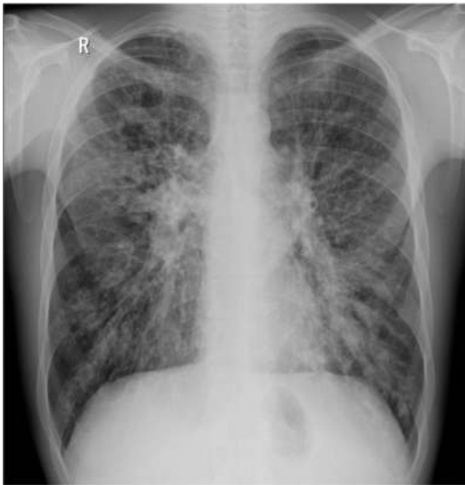
Рисунок 1. Рентгенограма. Хворий В., 25 років.

(Потовщення і ущільнення стінок бронхів (симптом паралельних лінійних і кільцеподібних тіней), розширення і втрата структури коренів легень, перибронхіальна інфільтрація).