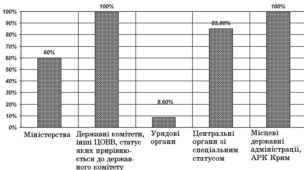
Рис. 2. Впровадження системи "Картка" ЦОВВ, АРК, місцевими державними адміністраціями.

Результати аналізу свідчать, що не всі керівники центральних та місцевих органів виконавчої влади використовують переваги автоматизованої системи управління персоналом та кадрового обліку.