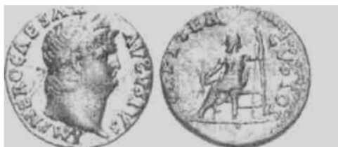
Рис. 3. Рим. Нерон. Ауреус. Золото. 66-67 р. до н.е.

Цікаво, що перші такі монети мали досить незвичний вигляд: спочатку їм надавали форми стріл (рис. 2) — на честь культу давньогрецького бога Аполлона, атрибутом якого були лук і стріли. Далі форма монет видозмінилася: грошові знаки набули форми рибок-дельфінів (рис. 1). Виготовлення монет звичної сьогодні круглої форми розпочалося в 480-470 рр. до н. е. Такі гроші отримали назву асів. Водночас північна частина українських земель, віддалена від колоніальних грецьких міст, істотно відрізнялася за рівнем розвитку грошового обігу, значною мірою застосовуючи для обміну товарні гроші.