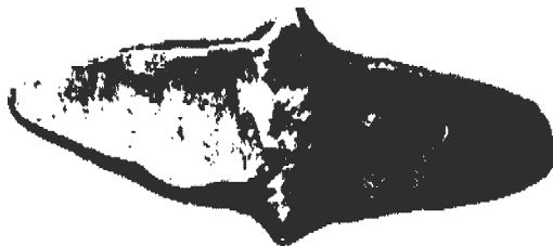
Рис. 5. Чернігівська монетна гривня

Першими монетами, карбованими на Київських землях, стали златники і срібляники князя Володимира Святославовича (кінець X ст.). Практично одночасно в обігу з'явилася і така грошова одиниця, як гривня. Вперше цей термін з'явився в IX ст. в договорі Русі з Візантією 4 . Тоді він використовувався як грошово-лічильна одиниця з метою вираження у сріблі (широко розповсюдженому на Русі в якості грошей) візантійської грошової одиниці — соліда. Стосовно походження слова "гривня" історики висувають дві версії. Згідно першої з них, цей термін походить від назви давньоруської прикраси — гривни, яка являла собою досить масивний металевий обруч, що носився на шиї ("загривку") і позначав статус її власника. Другою версією походження слова "гривня" є та, згідно якої гривною спочатку називали голову худоби, що первісно використовувалася в якості товарних грошей. У XI ст. слово "гривня" набуло іншого значення — вагового. Вага срібла могла складатися з певного числа однакових монет, тому поступово виник рахунок їх на штуки. З часом на Русі з'являються гривня срібна (вагова — між 160 та 205 грамами залежно від типу) та гривня кун (лічильна). Цікаво, що спочатку їхня собівартість була однаковою, але далі, внаслідок нестабільної ваги монет, одна гривня стала дорівнювати кільком кунам. В XII ст. гривня срібла (близько 204 г) по цінності вже дорівнювала 4 гривням кун (1 гривня кун=близько 51 г) 5 .