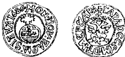
Рис. 6. “Севський чех”. Мідь. 1686 р.

польських грошей внаслідок укладення Андрусівського перемир'я в 1667 р. Старі запаси готівки вичерпувалися, значна кількість повноцінних грошей осідала у вигляді скарбів або ставала сировиною для ювелірного виробництва. Розмінні монети внаслідок частого використання стиралися і ставали непридатними для використання. Тому після тривалих переговорів з царською владою було прийнято рішення про початок карбування українських монет за зразками польських півтораків (чехів, рис. 6). Підготовка до такого виробництва була суворо секретною: в умовах розкладення польсько-московських стосунків російський уряд не хотів скандального розголосу навколо виробництва чехів, які разюче нагадували польські півтораки. Зокрема, усі грамоти, які стосувалися карбування чехів, що їх отримували царські воеводи, передбачалось ретельно зберігати, не допускати розголошення їхнього змісту, а після завершення терміну служби повертати до Малоросійського Приказу у Москві.