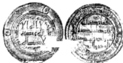
Рис. 4. Арабський дірхем. Срібло (705-714 рр.)