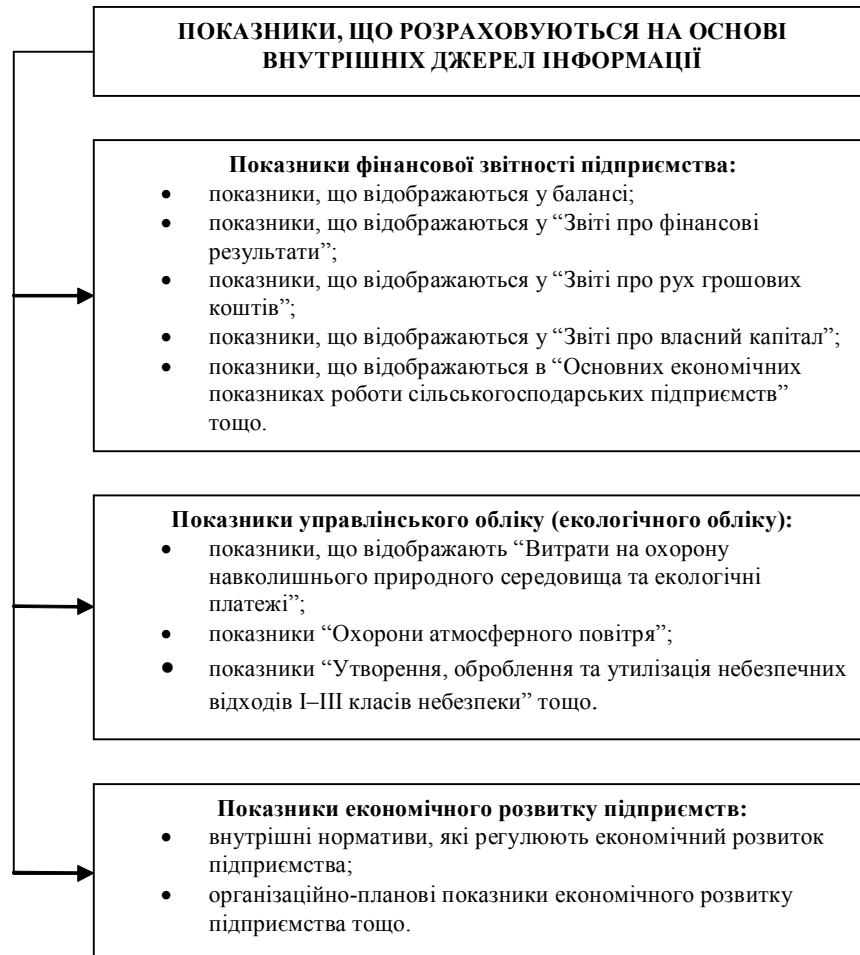
Рис. 1. Система інформаційного забезпечення оцінки еколого-економічної безпеки сільськогосподарських підприємств, яка формується за рахунок внутрішньої інформації