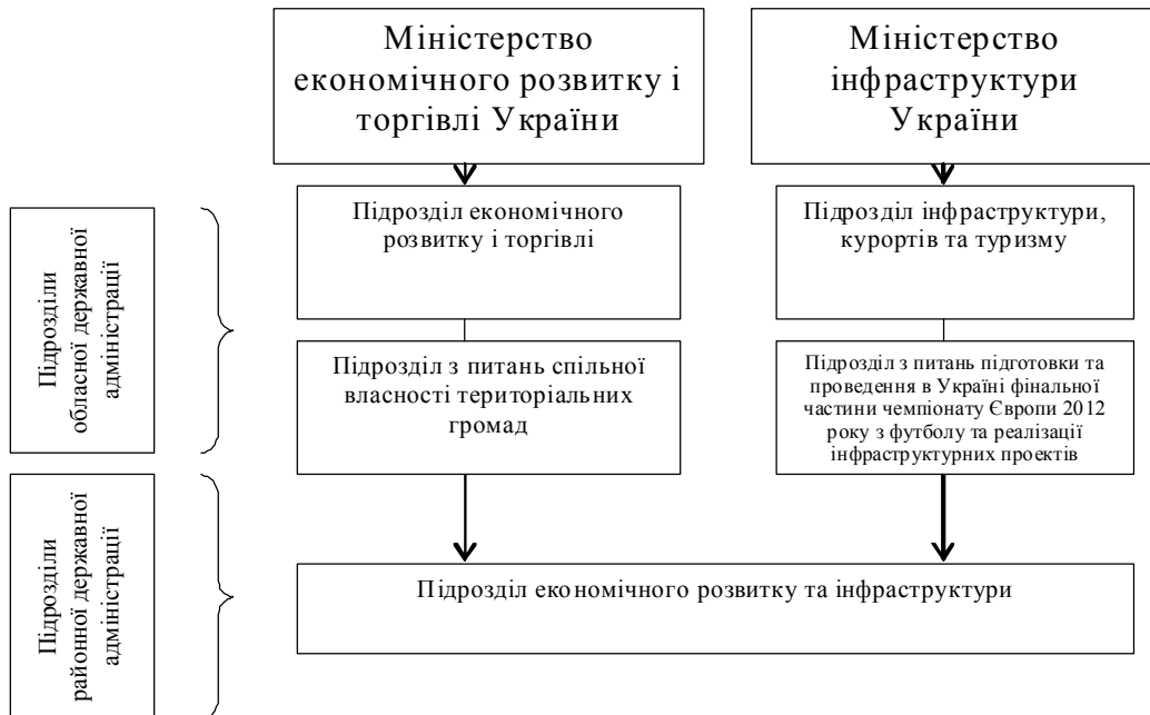
Рис. 2. Схема оптимізації органів виконавчої влади на місцях у туристично-рекреаційній сфері