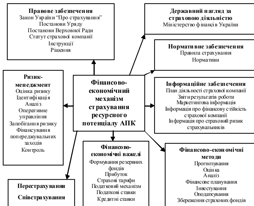
Рис. 3. Структура фінансово-економічного механізму страхування ресурсного потенціалу АПК

Під час страхування виникають грошові перерозподільчі відносини, причиною яких є наявність страхового ризику, можливість виникнення події, що здатна зумовити матеріальні або інші збитки. Розвиток ринкових відносин збільшує підприємницькі ризики. Науково-технічний прогрес підвищує техногенні ризики (пожежо- та вибухонебезпечності в деяких галузях матеріального виробництва, забруднення навколишнього середовища), зростання аварійності та травматизму на транспорті та інші. Тому ефективне функціонування фінансово-економічного механізму страхування ресурсного потенціалу АПК дозволяє зменшити ризики матеріальних, трудових ресурсів, відповідальності, екологічні та фінансові; формувати та розвивати взаємовідносини страховиків та страхувальників у межах дії концептуальної моделі страхування ресурсного потенціалу АПК як комплексної системи заходів запобігання ризиків в умовах ринку.