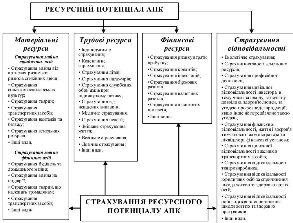
Рис. 2. Блок-схема концептуальної моделі страхування ресурсного потенціалу АПК

З'ясування впливу ризиків в аграрній сфері та важливість ефективного механізму їх запобігання потребує розробки концептуальної моделі страхування ресурсного потенціалу АПК як комплексної системи заходів зменшення спричинення можливої шкоди юридичним та фізичним особам в ринкових умовах господарювання, блок-схема якої відображена на рис. 2.