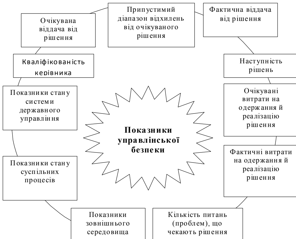
Рис. 3. Показники управлінської безпеки

Показники, за якими пропонується оцінювати управлінську безпеку в системі державного управління, наведені на рис. 3: очікувана віддача від рішення; припустимий діапазон відхилень від очікуваного рішення; фактична віддача від рішення; наступність рішень; очікувані витрати на одержання й реалізацію рішення; фактичні витрати на одержання й реалізацію рішення; кількість питань (проблем), що чекають рішення; показники зовнішнього середовища; показники стану суспільних процесів; показники стану системи державного управління; кваліфікованість керівника.