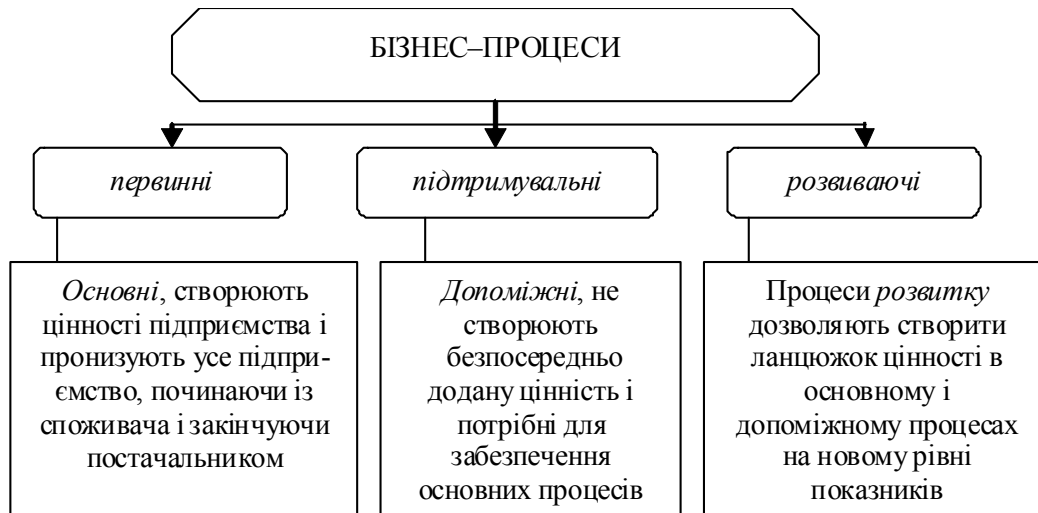
Рис. 1. Структурна схема бізнес-процесів відповідно до теорії Портера про ланцюжок цінностей [1, с. 98]

На відміну від попередньої класифікації, фахівці виділили розвиваючі бізнес-процеси, що підтримують неперервний цикл виробництва, та не включили процеси управління, зосередивши свою увагу безпосередньо на виробництві продукції.