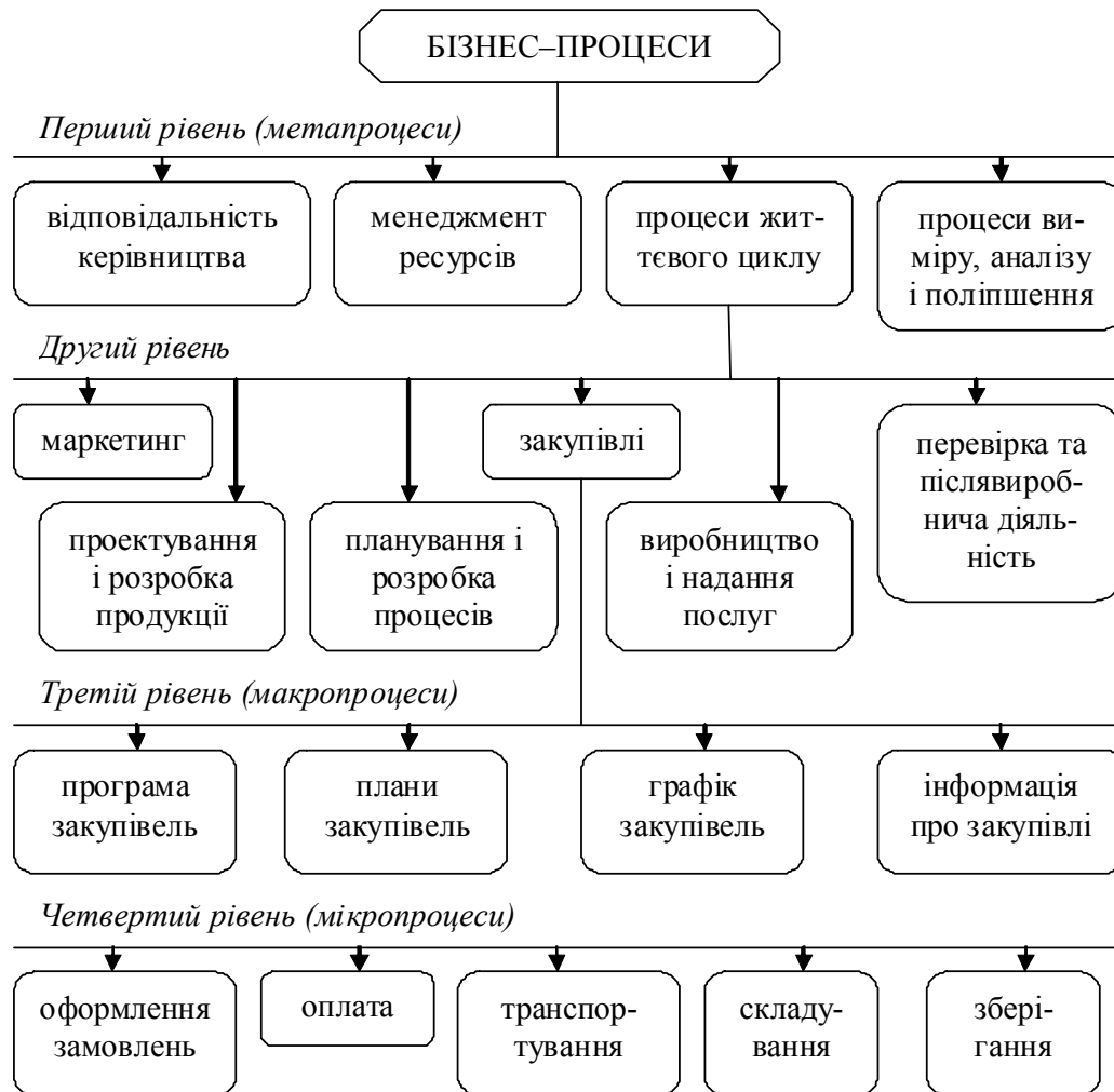
Рис. 3. Класифікація бізнес-процесів середнього промислового підприємства за рівнями значимості у системі управління якістю підприємства

Слід зазначити, що найбільш актуальною на сучасному етапі розвитку економічного середовища в умовах глобалізації є класифікація за призначенням (рис. 4).