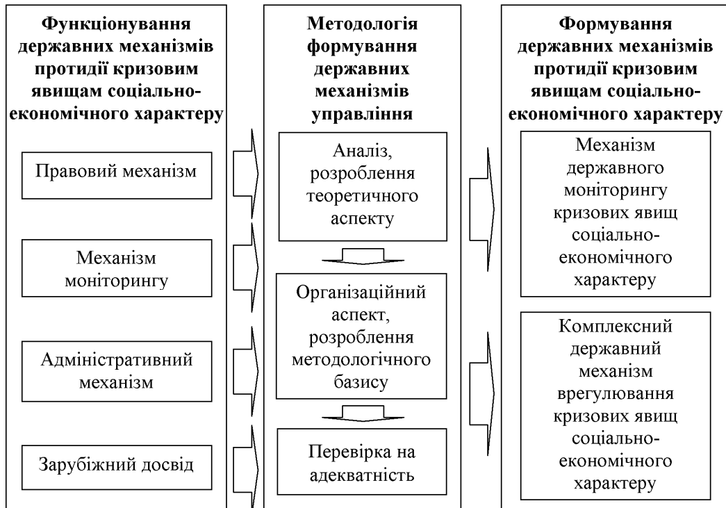
Рис. 2. Структурна схема формування державних механізмів протидії кризовим явищам соціально-економічного характеру

На основі наведеного підходу отримуємо розвиток державних механізмів протидії кризовим явищам соціально-економічного характеру, який схематично зображено на рис. 3.