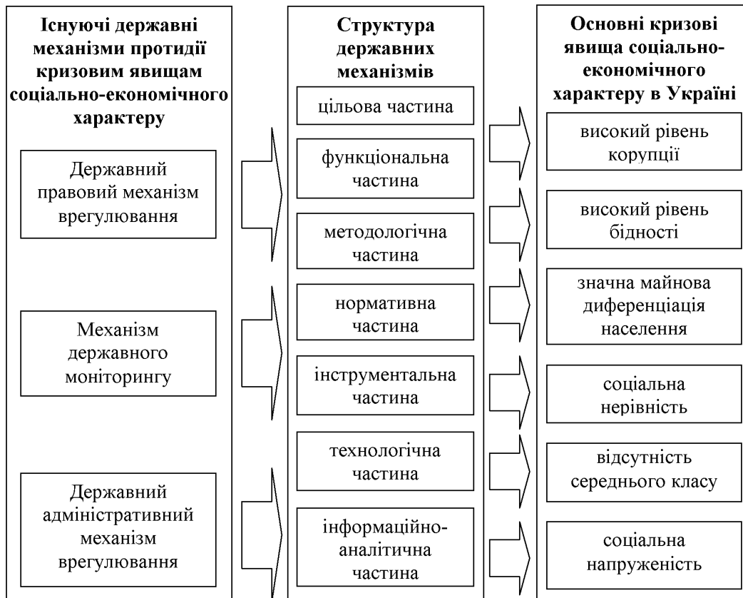
Рис. 1. Структурна схема функціонування державних механізмів протидії кризовим явищам в українському суспільстві