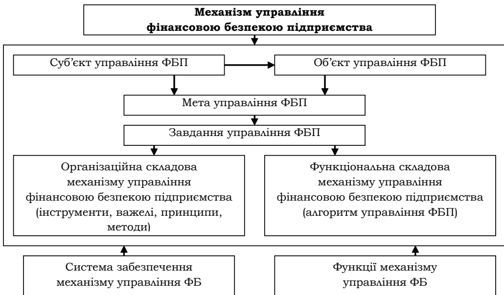
Рис. 1. Концептуальна схема механізму управління фінансовою безпекою підприємства

Механізм управління фінансовою безпекою підприємства повинен ґрунтуватися на розробці відповідної наукової теорії, концепції, стратегії і тактики, проведенні адекватної фінансової політики, систематизації загроз та фінансових ризиків, застосуванні засобів, способів і методів забезпечення фінансової безпеки (рис. 1).