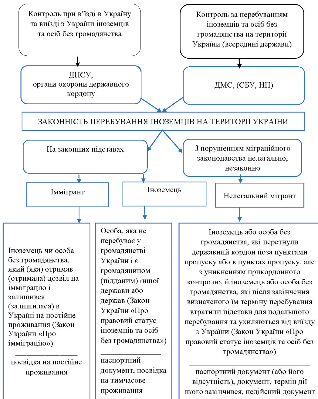
Рис. 1. Законність перебування іноземців на території України