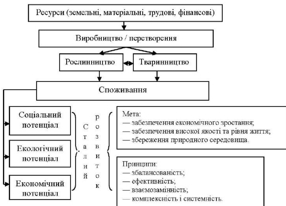
Рис. 1. Структура взаємопов'язаних галузей в аграрному секторі України

Інституціональність сукупного економічного потенціалу агропромислового підприємства виражається в тому, що його потенціал формується, використовується та розвивається з урахуванням правил, які розроблені інститутами, а склад і структура сукупного потенціалу кожного агропідприємства та визначається його особливостями як соціального, правового й ринкового інституту та функціонує в правовому полі, орієнтується на використання потенційних можливостей, що відкриваються ринковою економікою, і керується у своїй діяльності принципами соціальної корисності.