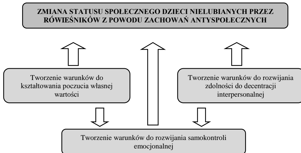
Rys. 1. Cel główny i cele szczegółowe programu wspomagania rozwoju psychospołecznego dzieci nielubianych przez rówieśników z powodu zachowań antyspołecznych.