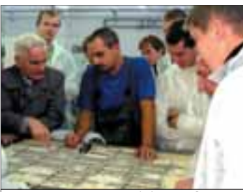
Перше заняття у філії кафедри машин і технологій пакування на фірмі «ВД «Укрпол»