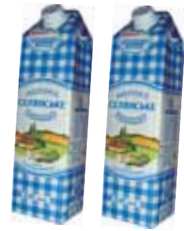
Tetra Gemina Aseptic 1 л