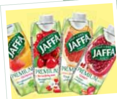
Tetra Prisma Aseptic 0,33 л Square