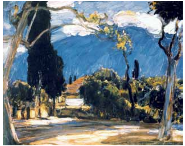
«Краєвид» (1935 р.)

вартостями. Крім численних матеріалів, зафіксованих у дослідницьких подорожах, він мав дуже добру власну колекцію старожитностей у Харкові і у своєму київському помешканні-майстерні на верхньому поверсі будинку М. Грушевського по вул. Паньківській. Обидва зібрання шедеврів народного мистецтва разом із книгами, проектами, картинами, безліччю підготовчих матеріалів загинули у 1918 р. Відомий будинок М. Грушевського цілеспрямовано був зруйнований гарматами більшовицького бронепоезда.