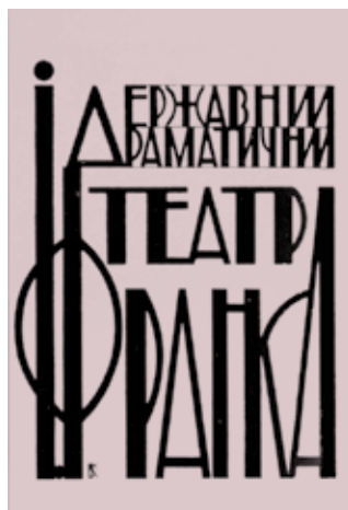
Афіша театру ім. Івана Франка (1930-ті рр.)