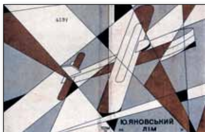
Обкладинка 4-го тому творів Ю. Яновського (1931 р.)