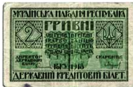
Державний кредитовий білет УНР «2 гривні». Лицева сторона (1918 р.)