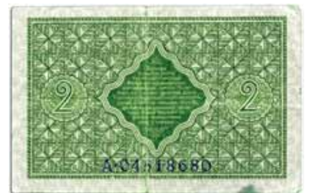
Державний кредитовий білет УНР «2 гривні». Зворотна сторона (1918 р.)

рожего ставлення українофобського оточення — сформував особистість з новою світоглядною позицією. Тривалі дослідження Василем Кричевським народного будівництва храмів і жител полтавських українців, розуміння їхніх уявлень про ідеальне життєве середовище і способи його облаштування з безліччю утилітарних предметів самобутньої доцільності і краси, майстерне використання місцевих матеріалів дозволили авторові досягти вражаючої довершеності цілого архітектурного