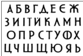
Мальований шрифт для друкарської гарнітури (1928–1930 рр.)