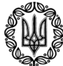
Малий державний герб УНР