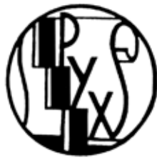
Друкарський знак видавництва «Рух» (1929 р.)