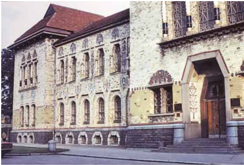
Фасадна частина будинку Полтавського земства (сучасний вигляд)