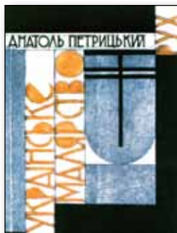
Обкладинка книги «Українське малярство. Анатоль Петрицький» (1930 р.)