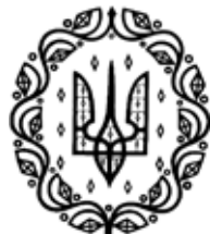
Великий державний герб УНР

Глибоке вивчення Василем Кричевським української культурної спадщини, звертання до неї, опертя на неї наче відкрили йому духовний генетичний код народу, що плідно рефлексувало у всій творчості майстра. Такий спосіб пізнання став творчим дороговказом у проектуванні і будівництві його першої великої і цілком самостійної споруди — Полтавського губерньського земства. Саме цей об'єкт — від нелегкого конкурсу проектів до завершення будівництва, додання несприйняття і відверто во-