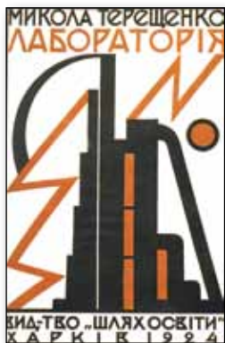
Обкладинка книги М. Терещенка «Лабораторія» (1924 р.)