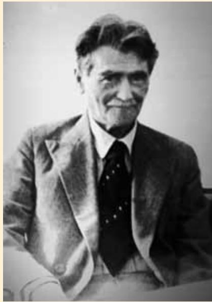
Василь Григорович Кричевський. Фото 1940 року

художників став ініціатором і фундатором Української академії мистецтв, її професором. Восени 1943 р. на запрошення митрополита А. Шептицького переїхав до Львова, де очолив Вищу мистецьку школу. Пізніше був змушений емігрувати до Європи, а у 1949 р. — до Венесуели. Помер у Каракасі 15 листопада 1952 р. Перепохований на українському цвинтарі св. Андрія в місті Бавн Брук, штат Нью-Джерсі, США.