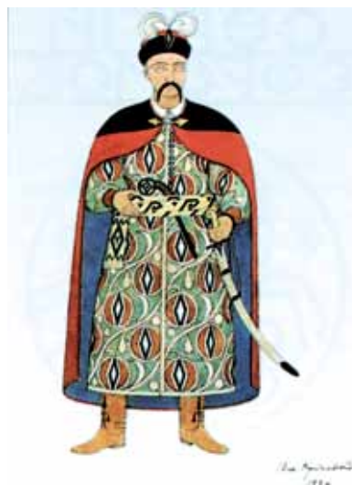
Ескіз костюма полковника для вистави «Богдан Хмельницький» (1920 р.)

Цей архітектурний шедевр і творча позиція Василя Кричевського потужно вплинули на українське мистецтво. Самому ж автору, уже знаменитому на той час, випала доля у різних царинах творчості бути першим або серед перших, реалізуючи ідейні засади, виборені у період роботи над Земським будинком.