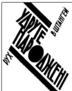
Обкладинка книги В. Штангея «Удруге народжені» (1930 р.)