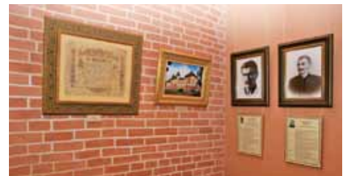
Музей мистецької родини Кричевських в Опішні

діда у цих кросівках?» Він дослухався і вийшло дуже гарно. Коли я передав ці старі орнаменти діда студентам Віталія Шості, то не мав гадки, що можна з ними зробити. Була тільки ідея — переробити їх на сучасний лад. Молоді люди якнайкраще адаптували орнаменти Василя Кричевського до сьогоденних речей. Тим самим вони підтвердили безмежні можливості мистецьких розробок діда. Коли я побачив ці проекти, радів, мов дитина, яка отримала цукерку.