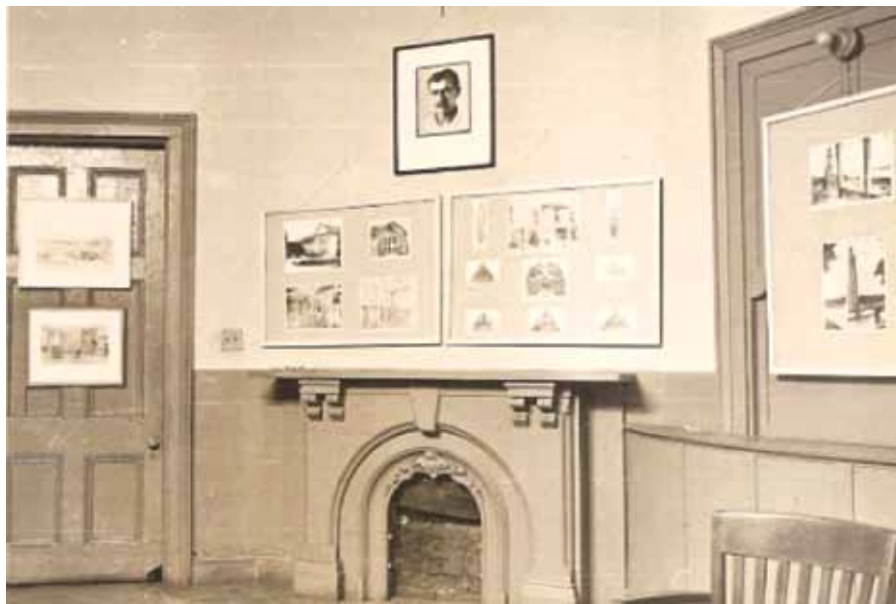
Експозиція про Василя Кричевського в Нью-Йорку (1962 р.)

тропічна країна, там не холодно, нема снігу. Дід такий клімат полюбляв, багато бував у Криму. Починати там було дуже важко, але у тата була робота, тому якось трималися. Жили бідно, грошей не вистачало. Взагалі, імміграція — це самі труднощі, інша країна, інші мова, культура й традиції.