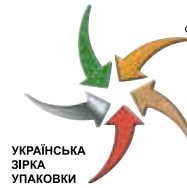
УКРАЇНЬКА ЗІРКА УПАКОВКИ