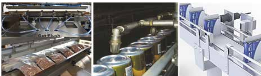
Рис. 1. Приклади використання ежекторів у функціональних соплових пристроях пакувальних машин

(Computational Fluid Dynamics) [3], коли система рівнянь Нав'є-Стокса або Рейнольдса вирішується за допомогою чисельних методів. Відсутність профільної бібліотеки для елементів функціональних модулів пакувальних машин є підставою для створення методології основ проведення CFD-розрахунків з метою їх систематичного застосування при виконанні досліджень, у тому числі для пневмосоплових ежекторів [4].