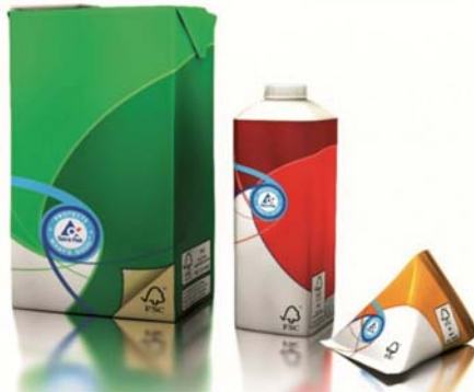
Рис. 5. FSC-сертифікована упаковка компанії Tetra Pak

Цікавим також є досвід компанії LEGO, що постійно працює над мінімізацією впливу на навколишнє середовище, впроваджуючи кращі практики зі скорочення паперових матеріалів, їх повторного використання та переробки. Адже щороку