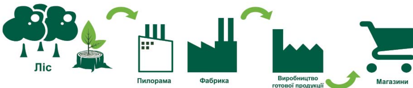
Рис. 1. Схема сертифікації ланцюга постачання

Таким чином, сертифікація FSC пропонує рішення, яке дозволяє шляхом незалежної сертифікації переконатися, що папір та інша сировина, яка продається або використовується в пакуванні, походять з відповідально керованих лісів, де забезпечено екологічно і соціально збалансоване ведення лісового господарства шляхом дотримання міжнародно визнаних принципів та критеріїв.