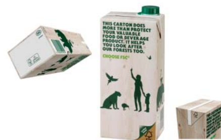
Рис. 2. Упаковка з логотипом FSC

Вихід сертифікованої продукції на ринок зазвичай передбачає маркування товару логотипом FSC (зображення у вигляді «дерева з галочкою»), який є зареєстрованим торговим знаком. Логотип FSC гарантує споживачеві легальність та сталість джерел походження деревини, яка використовувалась для виготовлення товару.