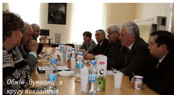
Обмін думками в кругу викладачів

Конференція закінчилась. Студентів запросили до святкового обіду із смачними напоями та соками, якими їх пригостила компанія Coca-Cola Beverages Ukraine, партнер конференції. А керівники кафедр, професори, доценти та викладачі зібрались на засідання круглого столу, на якому обговорили нагальні проблеми підготовки кадрів для пакувальної індустрії. Серед питань було покращення взаємодії кафедр з Клубом пакувальників та ІАЦ «Упаковка», використання інформаційних можливостей Клубу та Центру, підвищення активності в організації і проведенні студентської конференції. До речі, конкурс і конференція «Золотий каштан» наступного року будуть ювілейними – XX за рахунком. А це дуже відчутна нагода – підбити підсумки та найкраще підготуватися, щоб не тільки підняти ці інформаційні заходи на новий рівень, залучивши якомога більше вищих навчальних закладів, але й ще раз підтвердити високий рівень наукових досліджень українського студентства у напрямі дизайну, пакувальних технологій та обладнання.