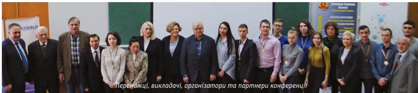
Переможці, викладачі, організатори та партнери конференції

Але у конференції є ще одна традиція. Це зближення пакувального студентства з представниками компаній та підприємств пакувальної індустрії. Я пам'ятаю, як на одній з таких конференцій один з виступаючих студентів одразу після свого виступу отримав пропозицію зайняти інженерну поса-