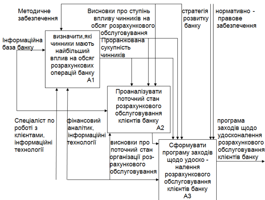
Рис. 2. Діаграма декомпозиції процесу розроблення програми вдосконалення розрахункового обслуговування клієнтів банку

Декомпозицію контекстної діаграми зображено на рис. 2.